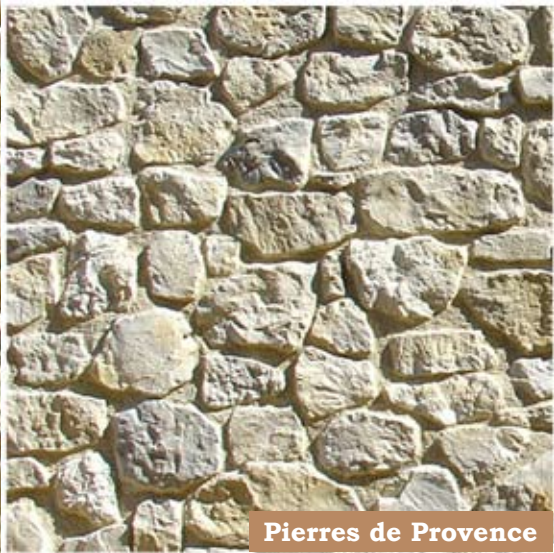
Pierres de Provence