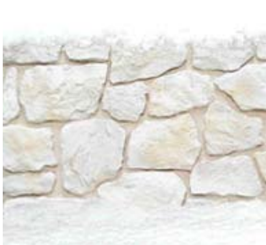
Résistant au gel

Pose : Les pierres sont posées individuellement contre les murs à l'aide d'un ciment colle ou un mortier. Composition : béton léger. Poids approximatif : de 48 Kg/m 2 . Epaisseur approximative : de 3 à 4 cm. Couleurs : Les couleurs sont une partie intégrante de la préfabrication. Résistance contre le feu : produit non combustible.