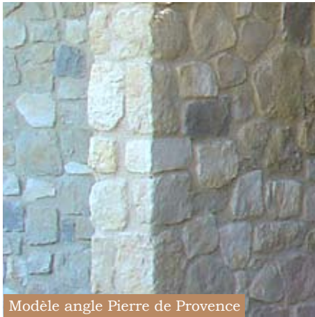
Modèle angle Pierre de Provence

L'emploi des pierres d'angles donneront un design supplémentaire à vos réalisations. Clés de voûte, angle pour jambage et linteau, chaîne d'angle, appuis et couvre mur.