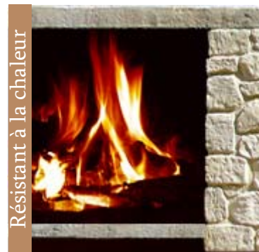
Résistant à la chaleur

Pose : Les pierres sont posées individuellement contre les murs à l'aide d'un ciment colle ou un mortier. Composition : béton léger. Poids approximatif : de 48 Kg/m 2 . Epaisseur approximative : de 3 à 4 cm. Couleurs : Les couleurs sont une partie intégrante de la préfabrication. Résistance contre le feu : produit non combustible.